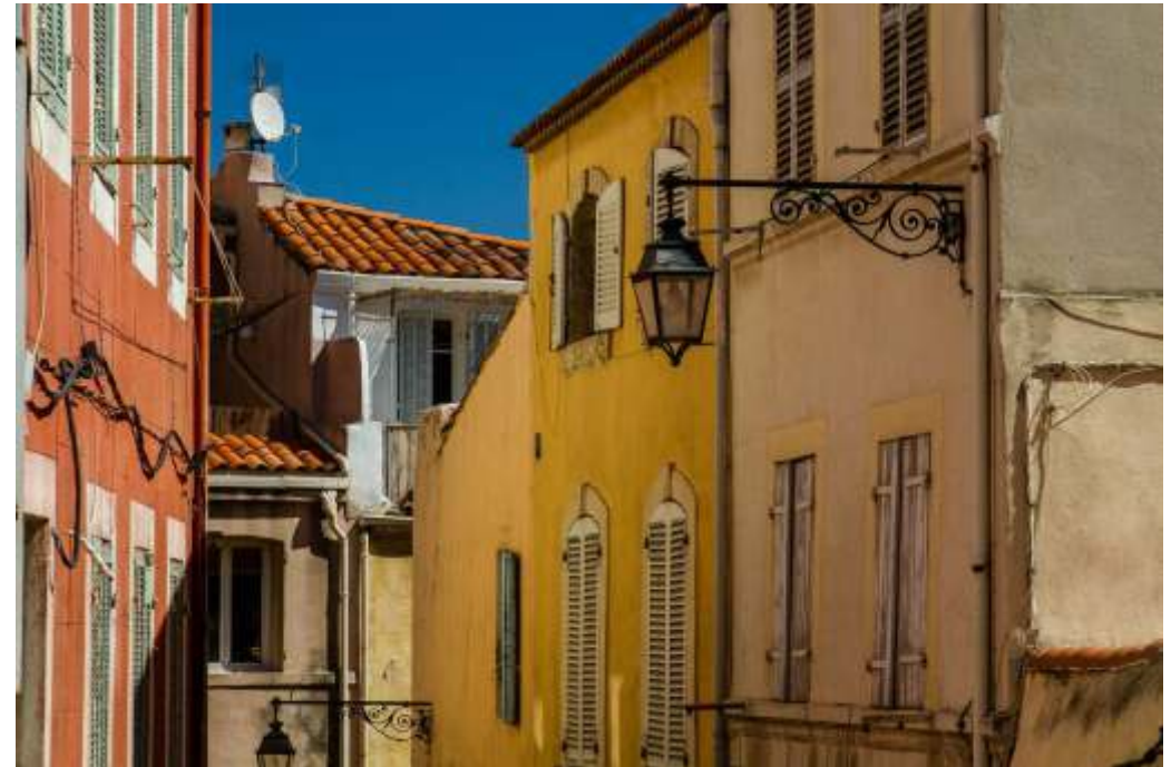
Quartier du Panier