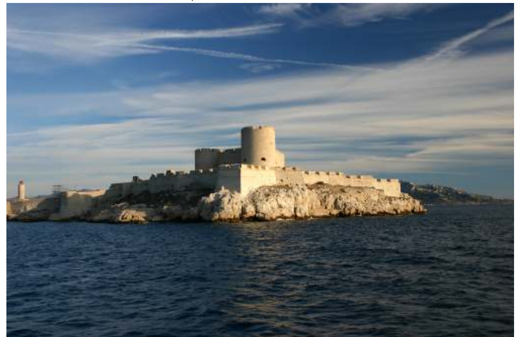
Île et Château d'If