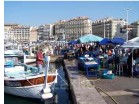
Marché aux poissons