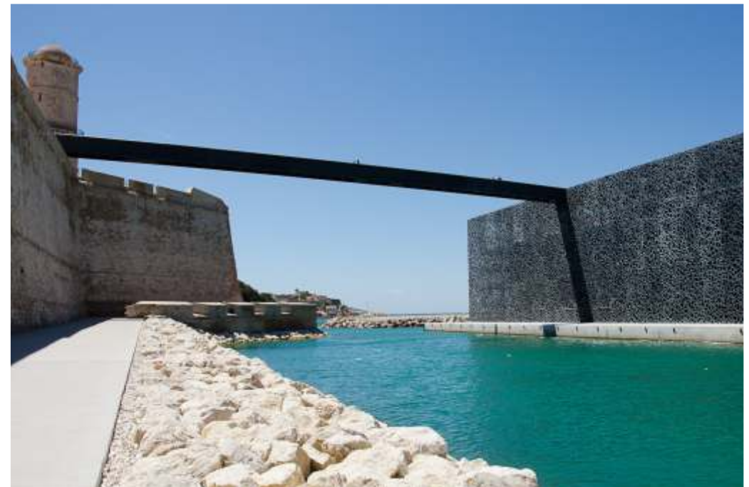
Fort Saint-Jean et MuCEM