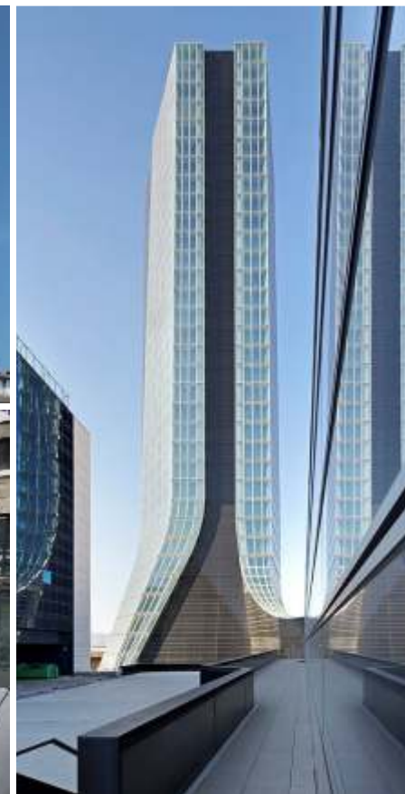
Euroméditerranée - Le Silo, Docks de la Joliette, Tour CMA-CGM