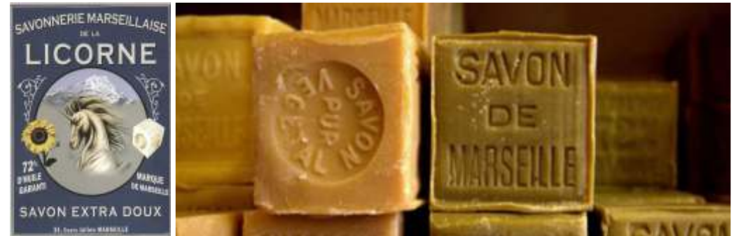
Savonnerie artisanale de la Licorne