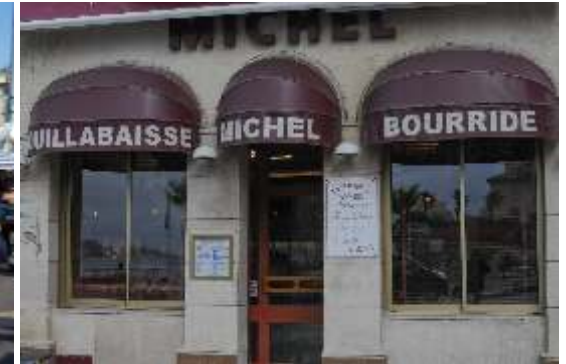
Restaurant «Chez Michel»