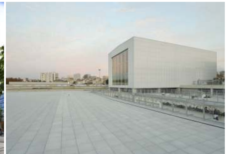
Friche de la Belle de Mai