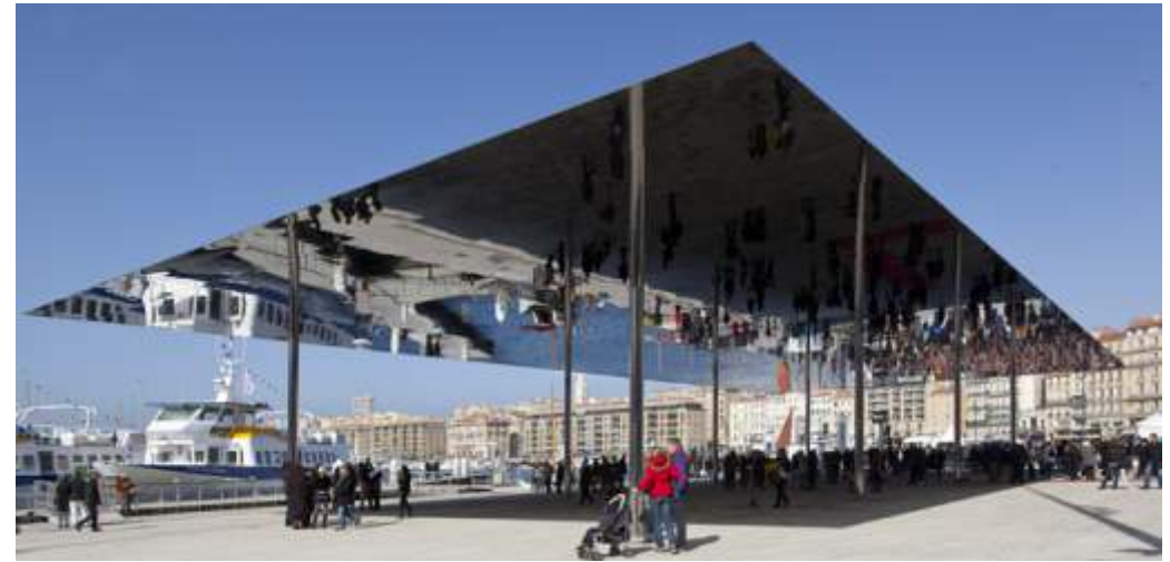
Ombrière Vieux Port