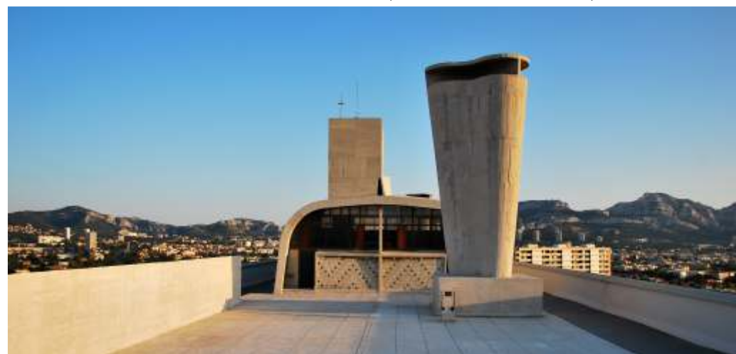
Unité d'Habitation de Marseille